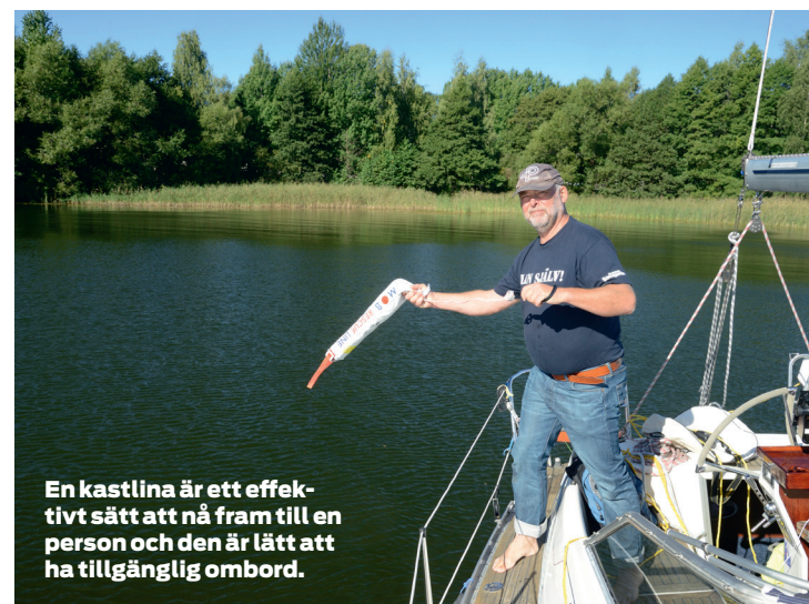
En kastlina är ett effektivt sätt att nå fram till en person och den är lätt att ha tillgänglig ombord.