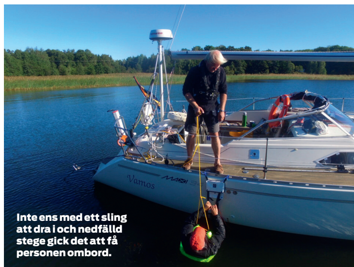
Inte ens med ett sling att dra i och nedfälld stege gick det att få personen ombord.