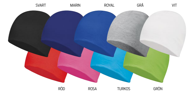
SVART MARIN ROYAL GRÅ VIT RÖD ROSA TURKOS GRÖN