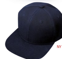
NY FÄRG! MARIN