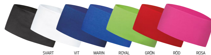
SVART VIT MARIN ROYAL GRÖN RÖD ROSA