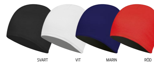
SVART VIT MARIN RÖD