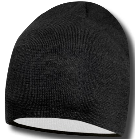
SVART, VITT FODER RUNT ÖRONPARTI