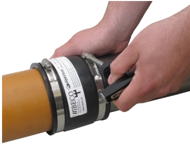
Fernco rörkopplingar: 6Nm