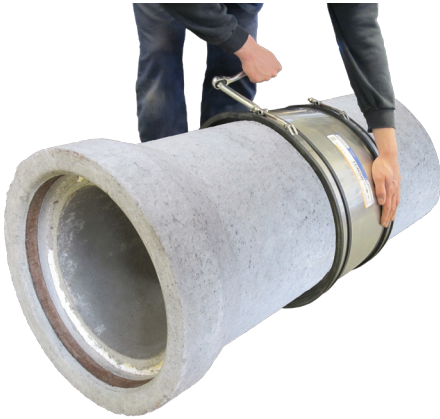
Flexseal rörkopplingar: 80 - 299mm, 6Nm

Drag åt slangklämmorna manuellt med en momentnyckel eller hylsskruvmejsel enligt ovan angivet åtdragningsmoment.