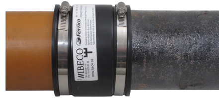
Provtryck Fernco/Flexseal rörkopplingen och dess applikation med 0,3bar.