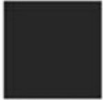
Block 1 - 5 ½" x 5 ½" 18 blocks