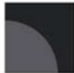
Block 5 - 11" x 11" & 9" x 9" 13 blocks sub cut for 35 blocks