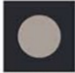
Block 2 - 5 ½" x 5 ½" & 4" x 4" 19 blocks