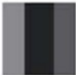
Block 4 - 2" x 5 ½" & 2 ½" x 5 ½" 17 blocks