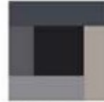
Block 3 - 3" x 3", 1 ¼" x 3", 1 ¼" x 4 ¼", 1 ¼" x 5 ½" 19 blocks