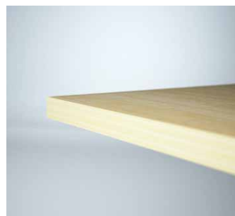
Profil 6 - 23 mm mdf rak kant, ABS dekorlist. Profile 6 - 23 mm mdf straight edge with ABS strip.