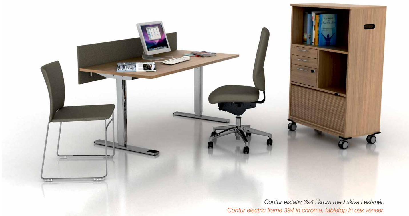
Contur elstativ 394 i krom med skiva i ekfanér. Contur electric frame 394 in chrome, tabletop in oak veneer.