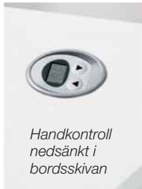
Handkontroll nedsänkt i bordsskivan