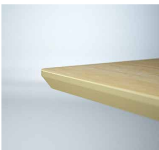
Profil 1 - 23 mm mdf fasad kant. Profile 1 - 23 mm mdf bevelled edge.