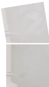
Färgytan kan se flammig ut under oxidationen men jämnar ut sig när färgen oxiderat färdigt.

På avjord.se/handla/komigang finns mer information och instruktionsfilmer för bl.a. blandning och målning av äggoljetempera. Tveka inte att höra av dig till din Färg i påse-handlare eller oss på Av jord om du undrar över något! På avjord.se finns kontaktuppgifter.