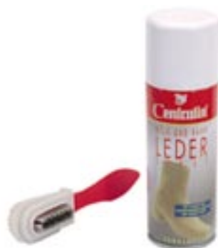
Mockaspray + borste