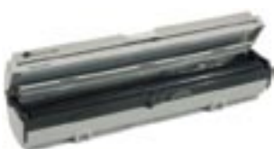
Wrapmaster 1000 (metallic)