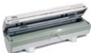
Wrapmaster 1000 (vit)